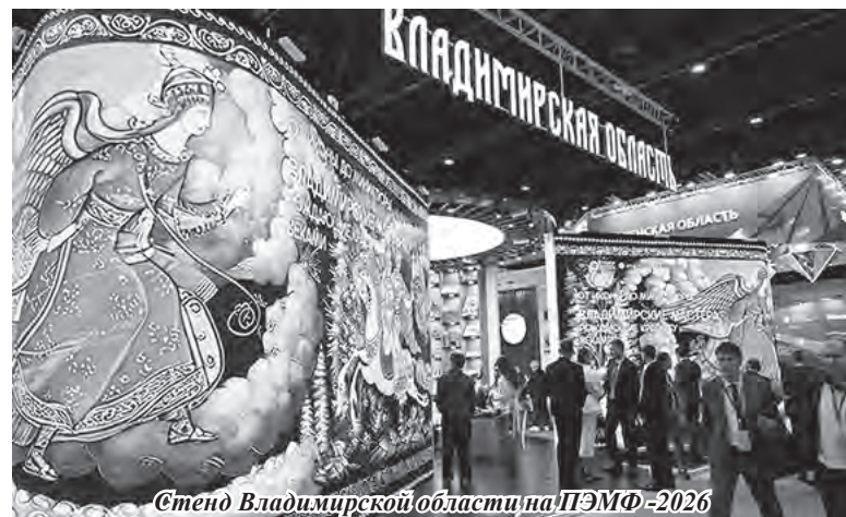
Стенд Владимирской области на ИТЭФ-2026

Основные задачи – повышение надежности электроснабжения потребителей региона, развитие сетевой инфраструктуры для новых инвестиционных проектов и