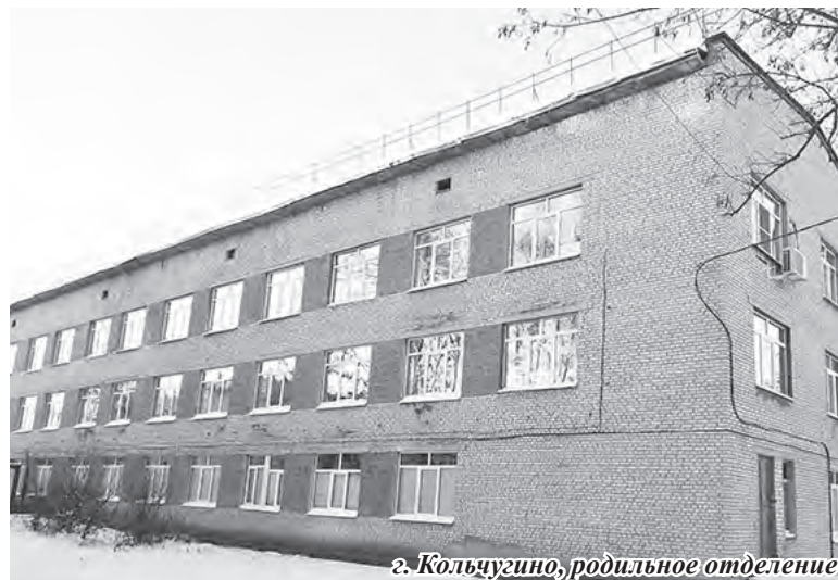
г. Кольчугино, родильное отделение

Набор проводится на добровольной основе путём заключения контракта с Минобороны России. Особенностью контракта является возможность совмещать