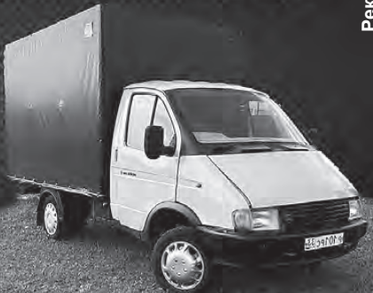
По заявлению учредителя СМИ. Реклама

ГРУЗОПЕРЕВОЗКИ ГРУЗЧИКИ - Перевезды любой сложности - Доставка мебели и техники - Бережная перевозка - Быстрая подача машины - Доступные цены - Без посредников - Работаем 24/7 г. Кольчугино +7(905)613-10-75