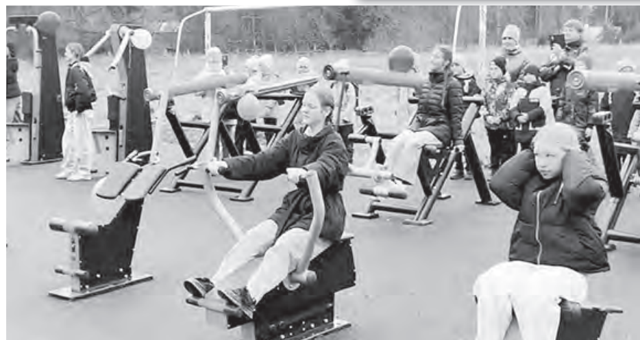
Спортивная площадка в пос. Бавлены. Открыта в 2025 году. Её стоимость – 7,2 млн руб., в том числе 3 млн руб. – средства областного бюджета