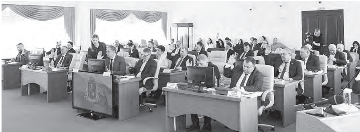
Подготовлено пресс-службой Законодательного Собрания Владимирской области

Перечень профессий рабочих, должностей служащих, по которым осуществляется профессиональное обучение указанных лиц, перечень организаций, осуществляющих образовательную деятельность, в которых осуществляется такое профессиональное обучение, а также порядок организации такого профессионального обучения определяет Министерство образования Владимирской области.