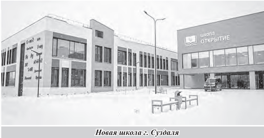
Новая школа г. Суздаля

Для региональной системы образования главным событием 2025 года стало открытие Муромского государственного педагогического института. При поддержке авторитетного партнёра – Российского государственного педагогического университета имени Герцена – МГПИ наравне с пединститутом ВлГУ и педколледжами будет обеспечивать кадрами образовательные организации нашего региона.