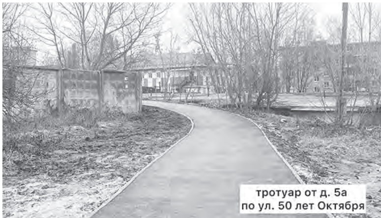
тротуар от д. 5а по ул. 50 лет Октября

Средства были распределены и освоены по всем муниципальным образованиям района следующим образом: