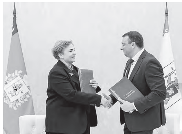
Подписание соглашения в сфере туризма