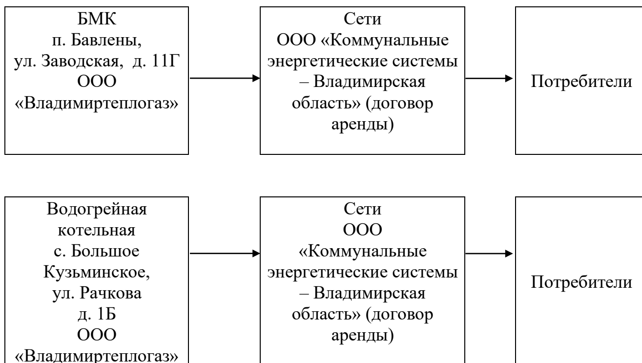
Рисунок № 1

Котельная п. Бавлены с 01.11.2023 находится на обслуживании ООО «Владимиртеплогаз». В качестве основного топлива на котельной используется природный газ. Тепловые пункты отсутствуют. Отопительный период длится 213 суток. На котельной п. Бавлены дополнительно предусмотрена круглогодичная выработка тепловой энергии на горячее водоснабжение потребителей.