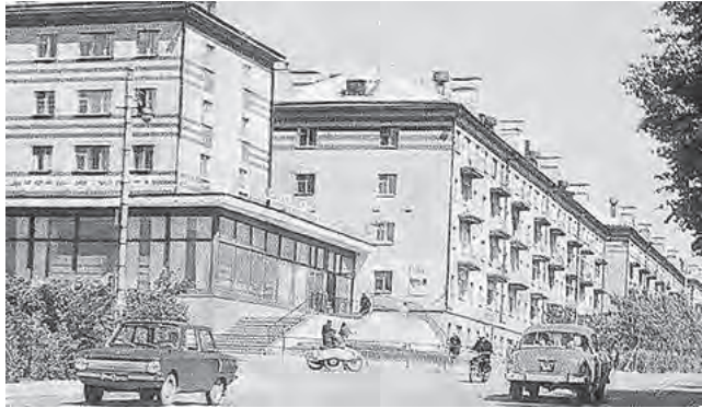
г. Кольчугино, середина 20 века

Судогодскому району направлено 5 млн 249,9 тыс. рублей на проект «К усадьбе В.С. Храповицкого через историю города». Спецификой маршрута, который пролегает от Краеведческого музея до усадьбы, является демонстрация новых объектов показа и видовых точек Судогды, а также увеличение числа всесезонных турпрограмм. На полученные средства будет установлен стенд с картой и туристская навигация по ходу следования групп, а в конце маршрута – в посёлке Муромцево, около дома №4