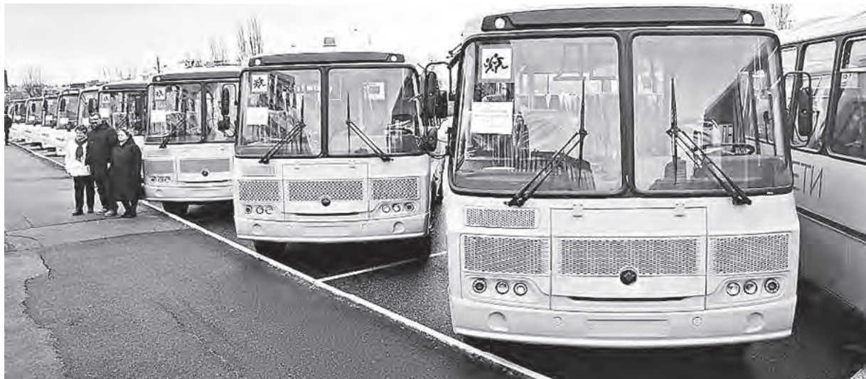
Подготовлено Управлением массовых коммуникаций

28 школьных автобусов, поставленных во Владимирскую область согласно распоряжению Правительства Российской Федерации, оборудованы аппаратурой спутниковой навигации ГЛОНАСС и тахографами – контрольными устройствами для непрерывной регистрации пройденного пути и скорости движения, времени работы и отдыха водителей. Вместимость нового транспорта – от 15 до 32 человек. Автобусы распределены в города и районы региона в зависимости от потребности образовательных организаций в замене отслужившей свой срок техники и в открытии дополнительных маршрутов. Ковровский район получил 5 новых автобусов, Гусь-Хрустальный – 4, Александровский – 3, Камешковский, Петушинский, Селивановский – по 2, по 1 отправились в школы Владимира, Коврова, Муром, Вязниковского, Гороховецкого, Кольчугинского, Меленковского, Собинского, Юрьев-Польского районов.