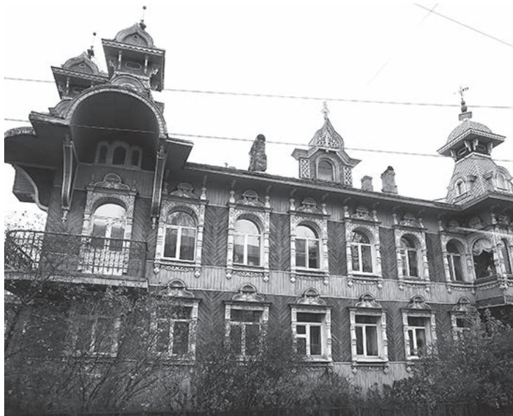
Исторический центр Рыбинска