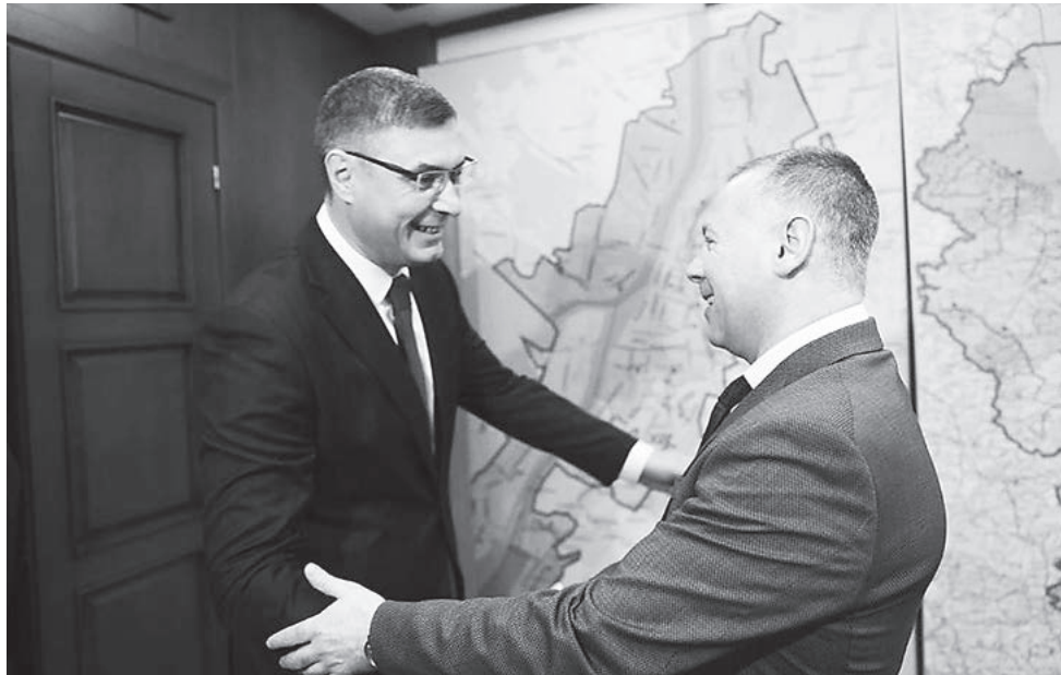
Александр Авдеев и Губернатор Ярославской области Михаил Евраев

Делегация нашего региона во главе с Александром Авдеевым 25 октября посетила с рабочим визитом Ярославскую область. Вместе с Губернатором Ярославской области Михаилом Евраевым владимирцы обсуждали совместную подготовку к 60-летию туристического маршрута «Золотое кольцо России», который отметят в 2027 году. Многие проекты в том числе могут быть реализованы с помощью национального проекта «Туризм и индустрия гостеприимства».