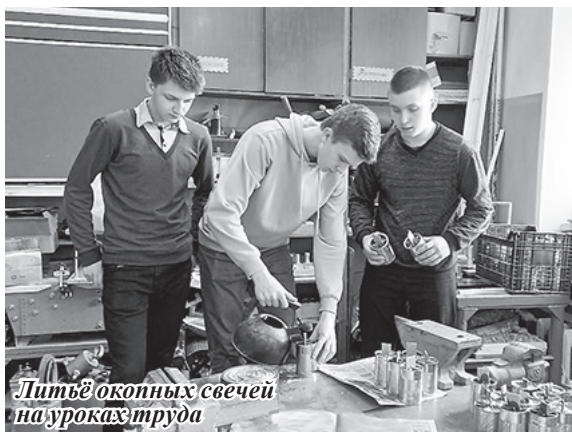
Литьё окопных свечей на уроках труда