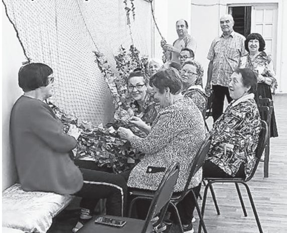
Участники ансамбля «Бавленочка» плетут маскировочные сети