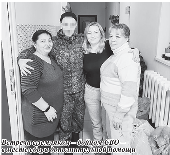
Встреча с земляком – бойцом СВО – вместе сбора дополнительной помощи