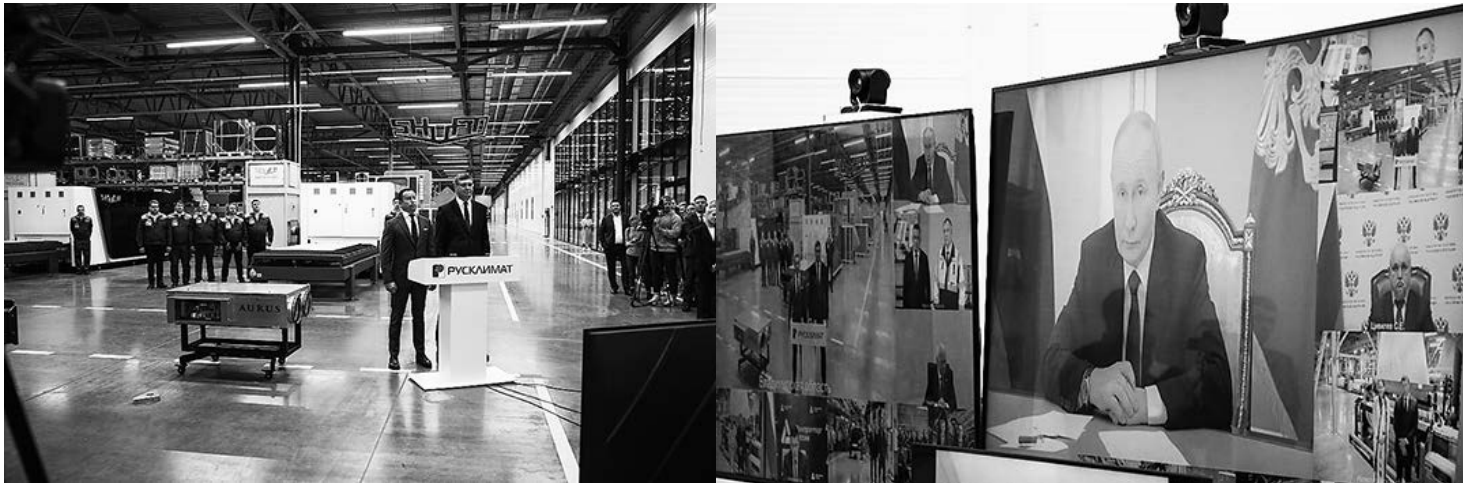
ВКС с Президентом России В. Путиным