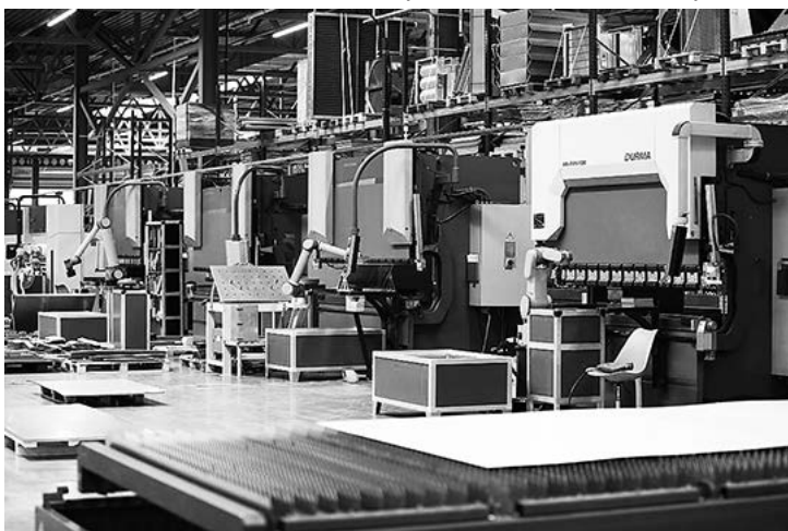
Одна из автоматизированных линий завода

И наша задача – совместно с «Русклиматом» создавать условия