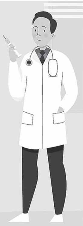
ГРАФИК РАБОТЫ дополнительных пунктов вакцинации ГБУЗВО «Кольчугинская ЦРБ» в октябре 2024 года

ИМЕЮТСЯ ПРОТИВОПОКАЗАНИЯ, ПРОКОНСУЛЬТИРУЙТЕСЬ СО СПЕЦИАЛИСТОМ