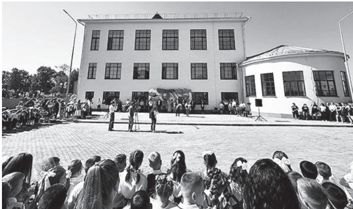
Лакинская школа, открытая после капитального ремонта в сентябре 2024 г.

– За это время открыты 6 школьных технопарков «Кванториум», 7 центров цифрового образования «IT-КУБ», «Точки роста»