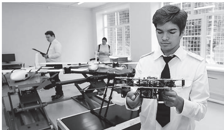
В аудитории центра практической подготовки по разработке, производству и эксплуатации беспилотных авиационных систем, г. Ковров