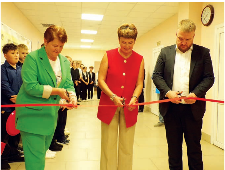
Окончание. Начало см. на 1 стр.

Современное образование – это залог успешного будущего подрастающего поколения, и особенно радостно, что на прошлой неделе в школе №4 (как и накануне в Макаровской школе) открылся один из современных центров – «Точка роста», а вместе с ним – и новые возможности для школьников.