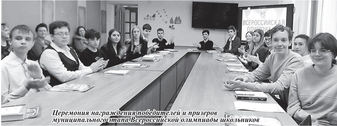
Церемония награждения победителей и призеров муниципального этапа Всероссийской олимпиады школьников