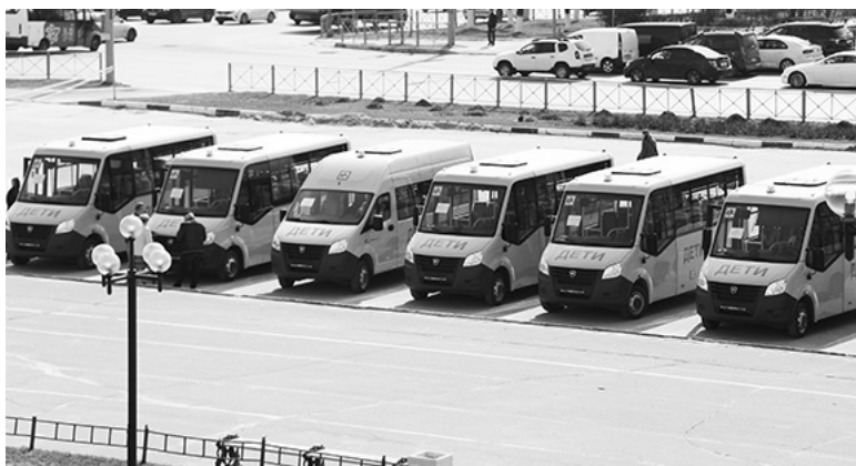
Новая партия школьных автобусов для образовательных учреждений области, апрель 2023

С 1 января этого года в стране реализуется новый нацпроект «Беспилотные авиационные системы», предусматривающий создание современной инфраструктуры для массового обучения. В рамках него в области будет создан Центр практической подготовки на базе Ковровского транспортного колледжа.