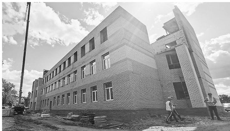
Строящееся здание новой школы в г. Вязники, 2023

федеральной программой «Профессионалитет». Приоритетными направлениями определены: сельское хозяйство, IT-сфера, радиоэлектроника, машиностроение, строительство, транспорт, фармацевтика, социальная сфера и сфера услуг.