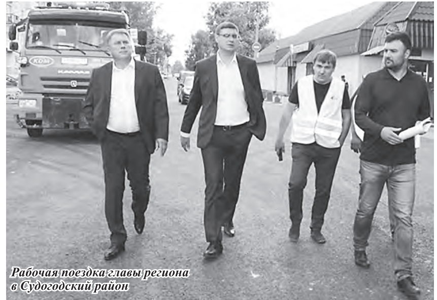
Рабочая поездка главы региона в Судогодский район