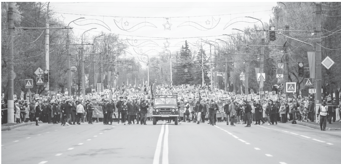
Подготовлено пресс-службой Законодательного Собрания Владимирской области