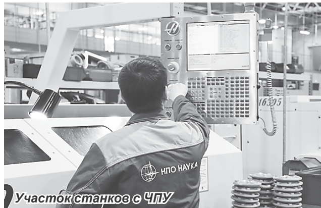
Участок станков с ЧПУ

Наш коллектив очень дружный. Новым работникам всегда рады, Опытные наставники обучают, подсказывают и помогают.