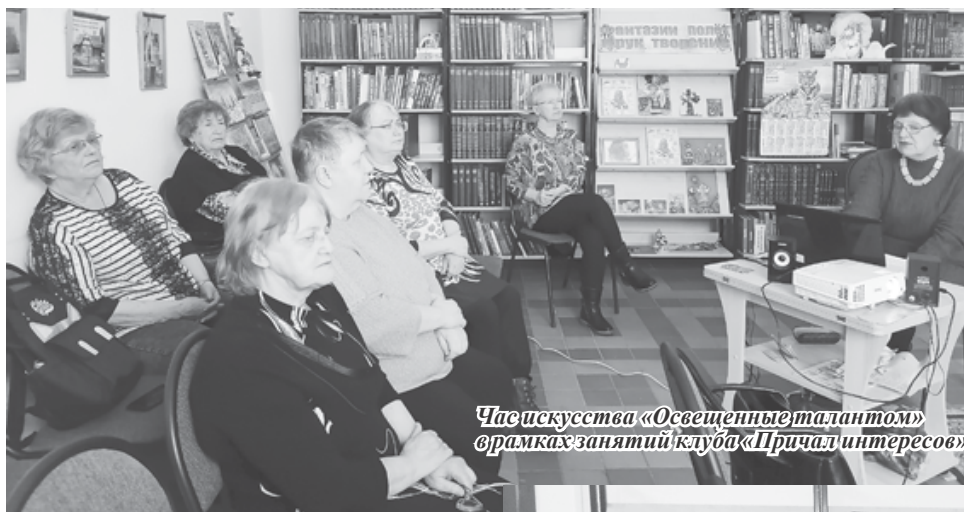
Час искусства «Освещённые талантом» в рамках занятий клуба «Причал интересов»