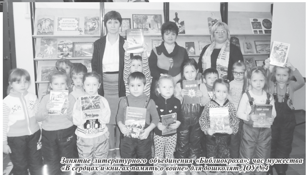
Занятие литературного объединения «Библиокроха»: час мужества «В сердцах и книгах память о войне» для дошколят ДОУ №4