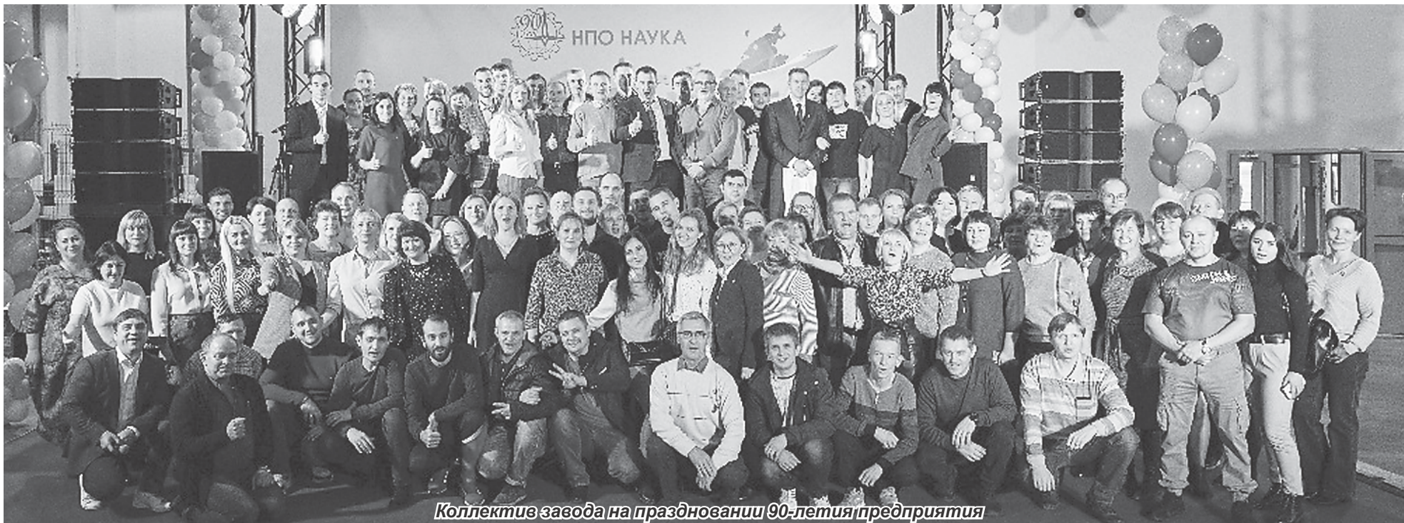
Коллектив завода на праздновании 90-летия предприятия

Давайте покорять новые высоты и горизонты вместе на благо российской авиации!