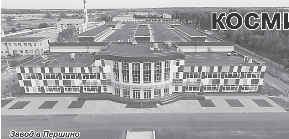
Завод в Першино

Специальности на заводе востребованы самые разные: инженеры-технологи и токари, шлифовщики и фрезеровщики, операторы-наладчики станков с ЧПУ и токари-расточники, слесари-сборщики, слесари-испытатели и другие.