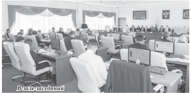
В зале заседаний

Глава региона обозначил, что если в регионе будут комфортные условия для жизни, меньше людей будет покидать Владимирскую область: «Людьми важно видеть своими глазами, что о них заботятся».