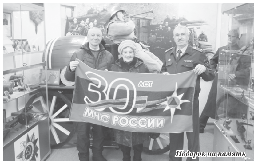
Подарок на память

завода с окладом содержания 80 рублей в месяц.