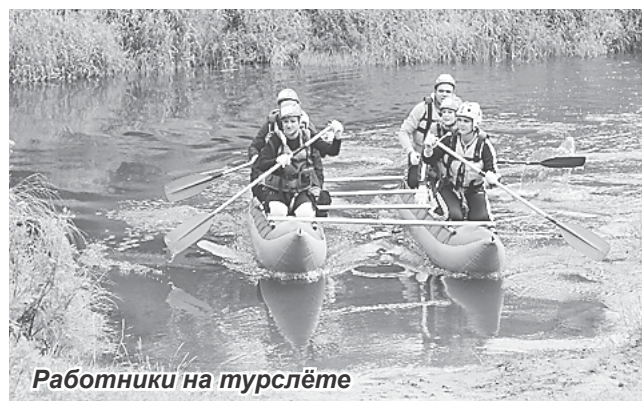
Работники на турслёте

Дорогие друзья, если вы хотите работать на стабильном предприятии и развиваться вместе с ним, участвовать в создании самых прорывных самолетов и вертолетов, двери НПО «Наука» для вас открыты! Получить дополнительную информацию о вакансиях можно по телефонам: 8 (49237) 7-64-50, 2-55-07.