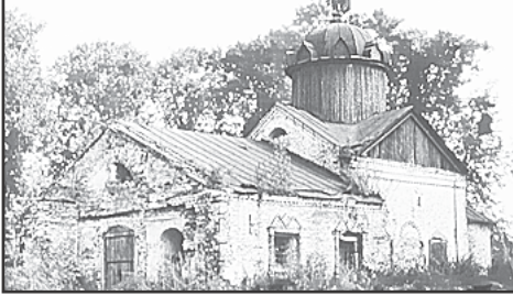
Никольская церковь села Есиплево. Фото 1986 года.