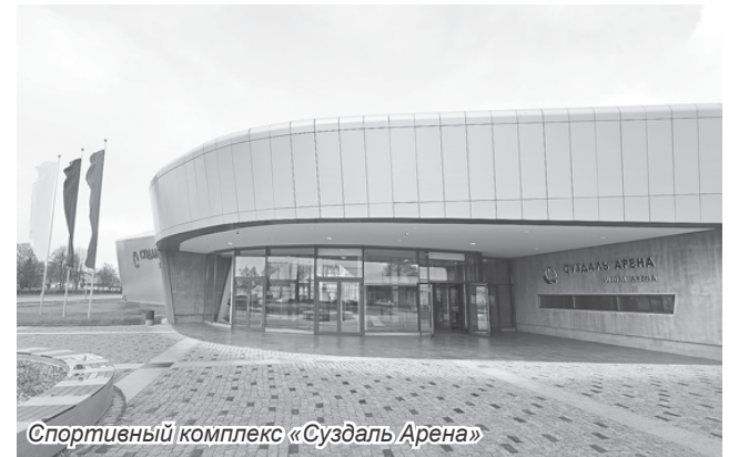
Спортивный комплекс «Суздаль Арена»

Ещё одна важная тема – развитие студенческого спорта. Олег Матыцин сообщил, что в федеральном бюджете на следующую трёхлетку это направление выделено отдельно: