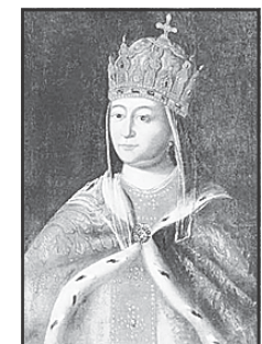
Первая супруга Петра I царица Евдокия, в девичестве Лопухина

В 1718 г. престижная богатая жизнь Никиты Ивановича закончилась. Он оказался под следствием «В его Императорскаго Величества деле».