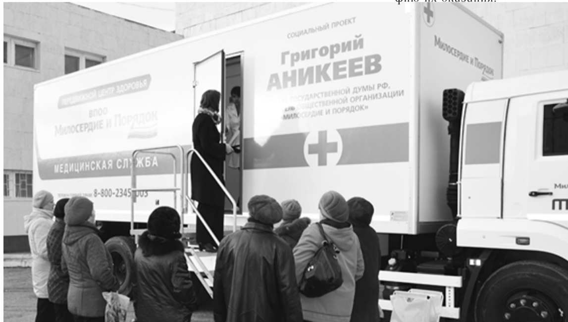
За год центры смогут принять более 50 тысяч человек

Чтобы люди смогли влиять на качество оказываемых услуг, к следующему совещанию Григорий Аникеев поставил новые задачи — выстроить современную систему контроля по сбору и обработке отзывов посетителей, чтобы каждый житель мог дать свою оценку работе комплексов. Также депутат дал задание расширить спектр медицинских услуг и географию их оказания.