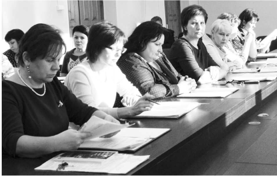
2 ноября состоялось заседание коллегии администрации Кольчугинского района, главным вопросом повестки дня которого стало формирование бюджетов города Кольчугино и Кольчугинского района в целом.