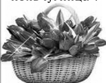
Стоимость стандартного поздравления – от 70 руб.

ПОЗДРАВЬТЕ своих родных, близких и знакомых в газете «Голос кольчугинца»!