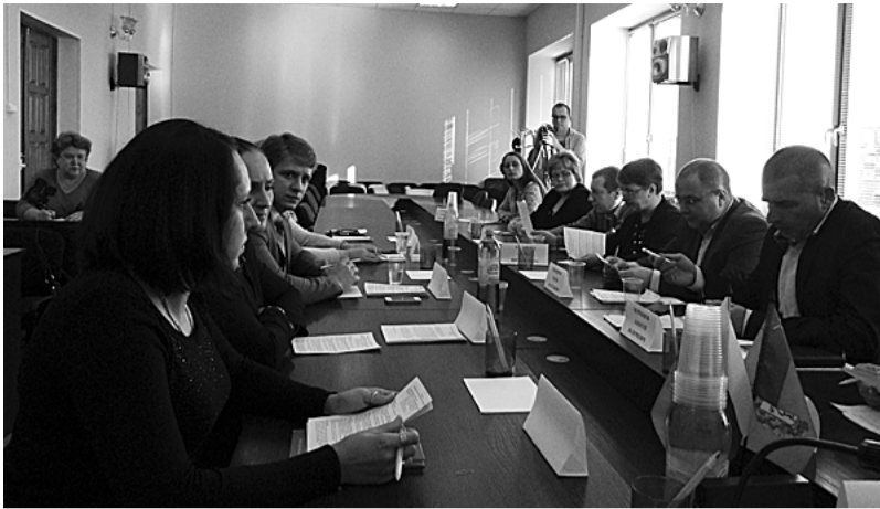
21 октября состоялось внеочередное заседание Совета народных депутатов Кольчугинского района 5 созыва, в повестке дня которого значились восемь вопросов. И, забегая вперед, отметим, что решения были приняты по каждому из них.

ЗАСЕДАНИЕ РАЙОННОГО СОВЕТА НАРОДНЫХ ДЕПУТАТОВ