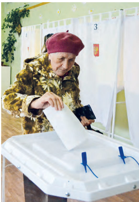
набрали одинаковое количество голосов. В Кольчугинском районе избирали депутатов представительных органов муниципальных образований. О том, как голосовали кольчугинцы, читайте на 2 и 3 страницах газеты.