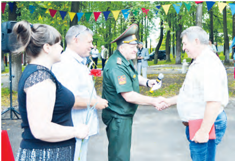
2 августа в парке Дворца культуры отметили юбилей образования воздушно-десантных войск. 85 лет назад под Воронежем на учениях Московского военного округа состоялось первое десантирование подразделения пехотинцев. С того времени воздушно-десантные войска не раз проявляли себя, выполняя сложнейшие боевые задачи, первыми штурмуя горячие точки, по праву став элитой Вооружённых Сил нашей страны.