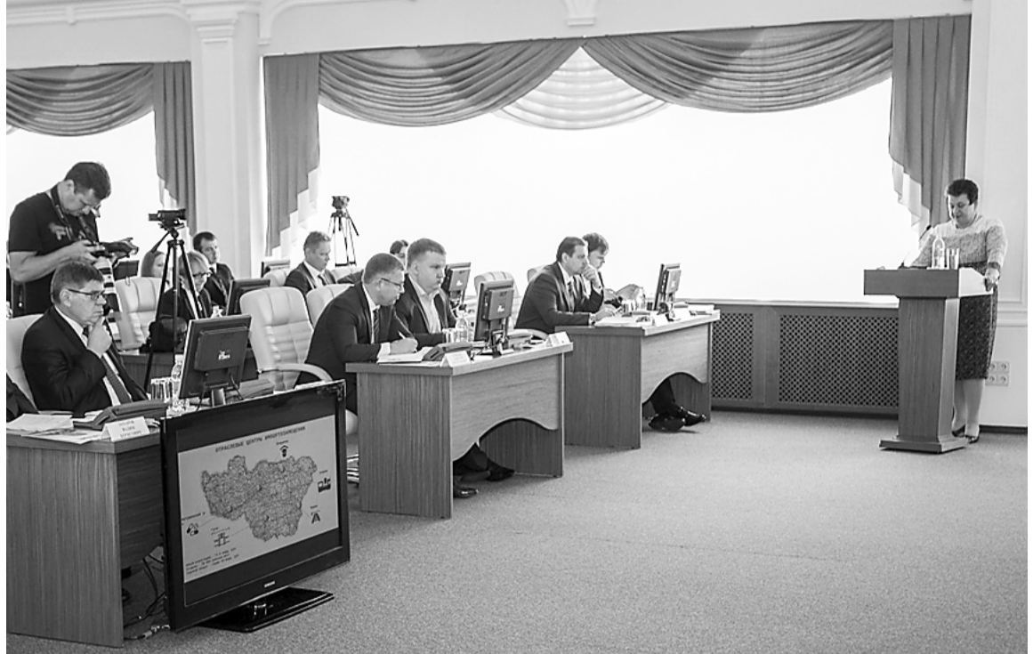
Идёт отчёт на Законодательном Собрании

В рамках центра импортозамещения высокоточного машиностроения, станкостроения и робототехники налажены кооперационные связи между ОАО «Ковровский электромеханический завод» и 47 предприятиями малого и среднего бизнеса. Объём