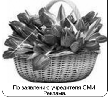
По заявлению учредителя СМИ. Реклама.