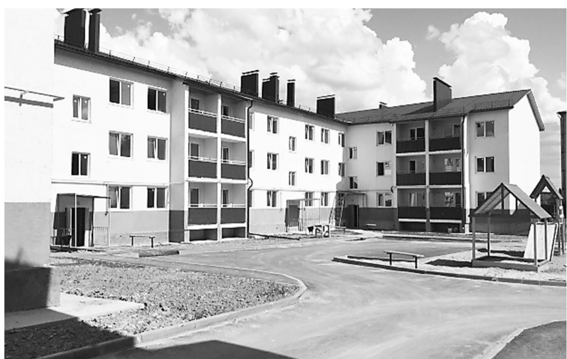
Многоквартирный дом №9 по улице Майская в городе Лакинск, в который из аварийного жилья переедут 107 человек

лагеря «Сосновый бор» к безопасному пребыванию в нём детей и подростков. По информации ГУ МЧС России по Владимирской области на учете в инспекторских подразделениях состоит шесть мест отдыха детей на воде. В настоящее время все они приняты к эксплуатации. Для обеспечения безопасности де-