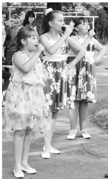
1 июля в микрорайоне №3, на площадке по улице Добровольского, состоялся веселый праздник «А у нас во дворе», который положил начало череде столь же веселых, торжественных мероприятий, приуроченных к празднованию Дня города Кольчугино.

Очень хочется надеяться, что в момент непростого выбора ориентиром для нас всегда будут служить такие понятия как любовь и ответственность, и, безусловно, великий пример жизни Святых Петра и Февроньи.