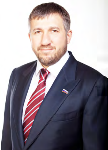
Григорий АНИКЕЕВ, депутат Государственной Думы РФ, председатель ВПОО «Милосердие и порядок»

Желаю вам крепкого здоровья, тепла и любви родных и близких, благополучия и добра в доме!