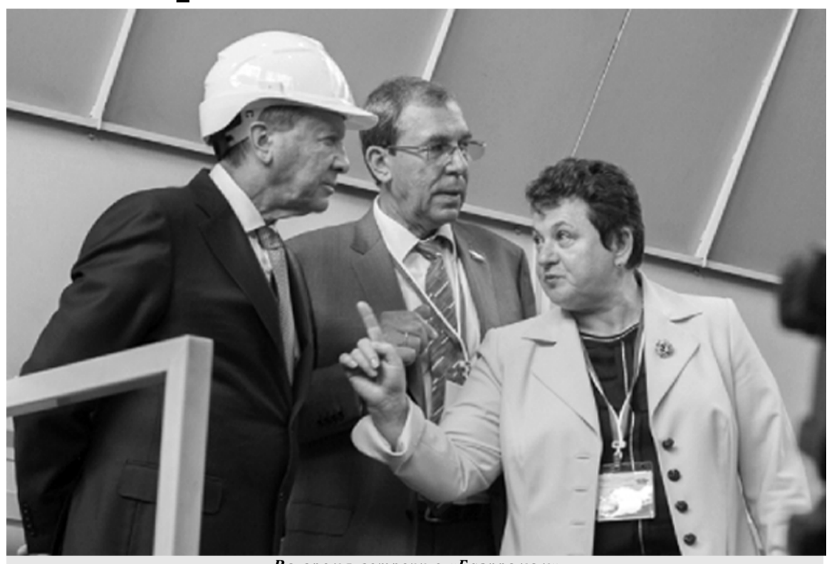
Во время встречи с «Газпром»

Затем в ходе совещания участники обсудили ключевые вопросы развития импортозамещения в формате живого диалога. Для «Газпрома» эта тема является приоритетной. Многие годы компания ведет последовательную работу по замене зарубежного оборудования отечественными аналогами. Сегодня доля российской продукции в централизованных закупках