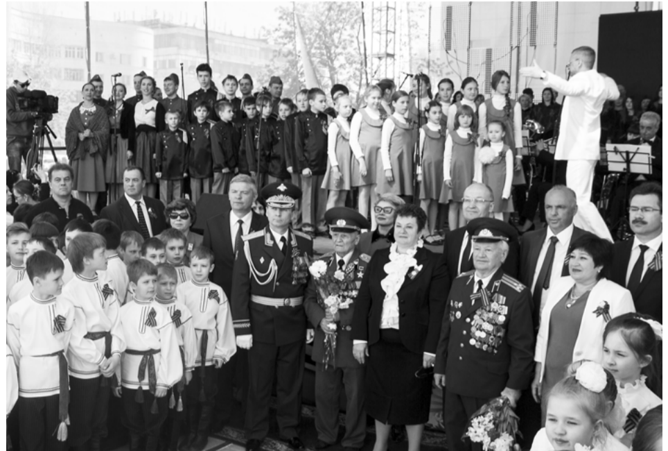
Гимн Победе в исполнении региональной «хоровой ассамблеи»