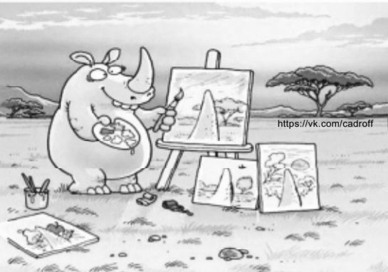
Каждый видит мир по своему...

— Дождь. Ветер. Иду ночью по лесу, замерз весь. Смотрю — машина стоит, подхожу, в окошко смотрю, а там никого. Дверцу полюбавал — открыто, залез и сижу. Вдруг машина поехала, я сзади сижу, а за рулем никого. Рука откуда-то появляется, рупит и исчезает. У меня волосы дыбом встали. Тут деревня показалась, вот уже дома первые... Машина останавливается, в салон заглядывает мужчина и спрашивает: