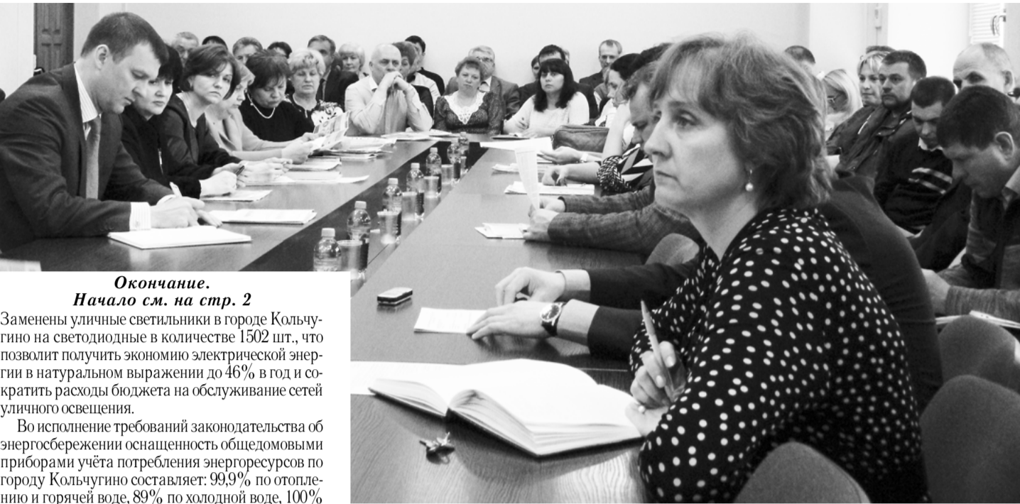
Окончание. Начало см. на стр. 2

Заменены уличные светильники в городе Кольчугино на светодиодные в количестве 1502 шт., что позволит получить экономии электрической энергии в натуральном выражении до 46% в год и сократить расходы бюджета на обслуживание сетей уличного освещения.