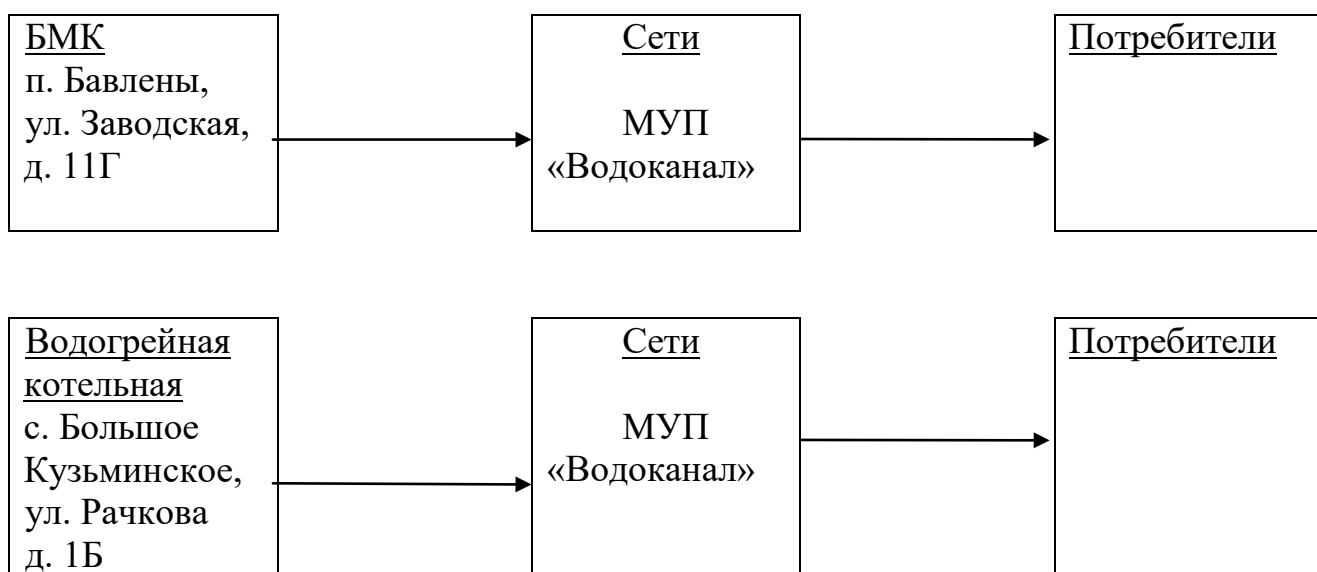
Рисунок № 1

В связи с тем, что в Бавленском поселении эксплуатация источников теплоснабжения и присоединённых тепловых сетей осуществляется разными юридическими лицами, необходимо предусмотреть согласованность действий между оперативным и эксплуатационным персоналом данных предприятий, в т.ч. за счёт принятия единых внутренних регламентов и инструкций.