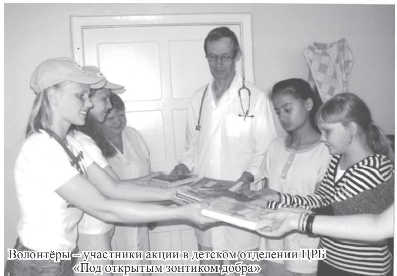
Волонтеры – участники акции в детском отделении ЦРБ «Под открытым зонтиком добра»

В полной мере свой креативный потенциал они проявили в библиотечном проекте «Открытый мир», который набирает обороты и направлен на организацию работы с детьми, не имеющими возможность посещать библиотеку по состоянию здоровья. Волонтеры разработали план офлайн-общения с использованием громких чтений произведений по школьной программе с дальнейшим обсуждением. Часто они являются соведущими библиотечных мероприятий, чтобы грамотно и интересно под-