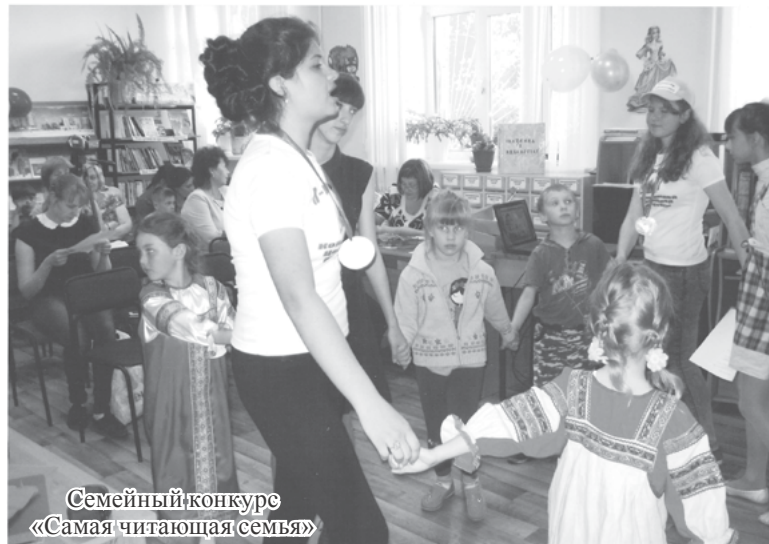
Семейный конкурс «Самая читающая семья»