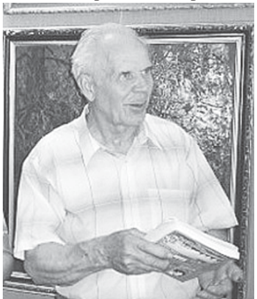
Народный художник России Прохоров Константин Александрович