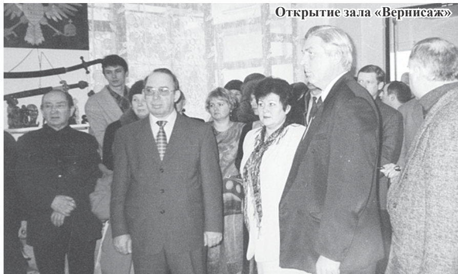
Открытие зала «Вернисаж»