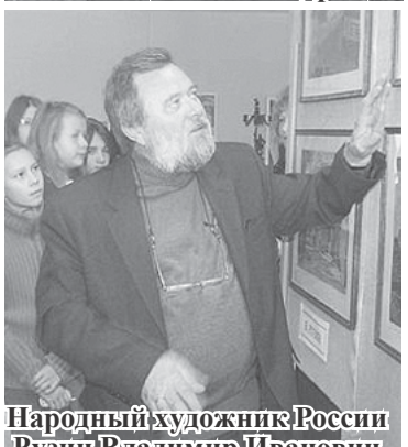
Народный художник России Рузин Владимир Иванович