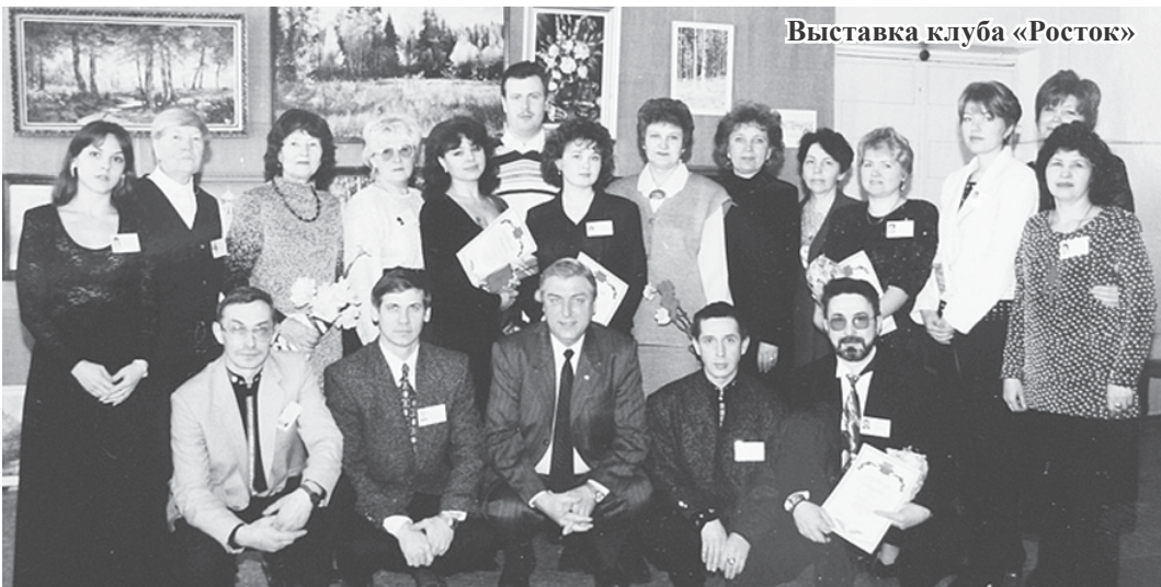
Выставка клуба «Росток»