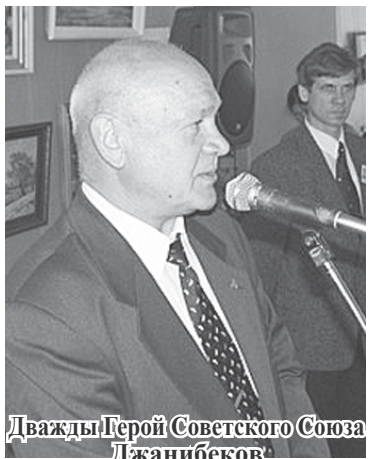
Дважды Герой Советского Союза Джанибеков Владимир Александрович