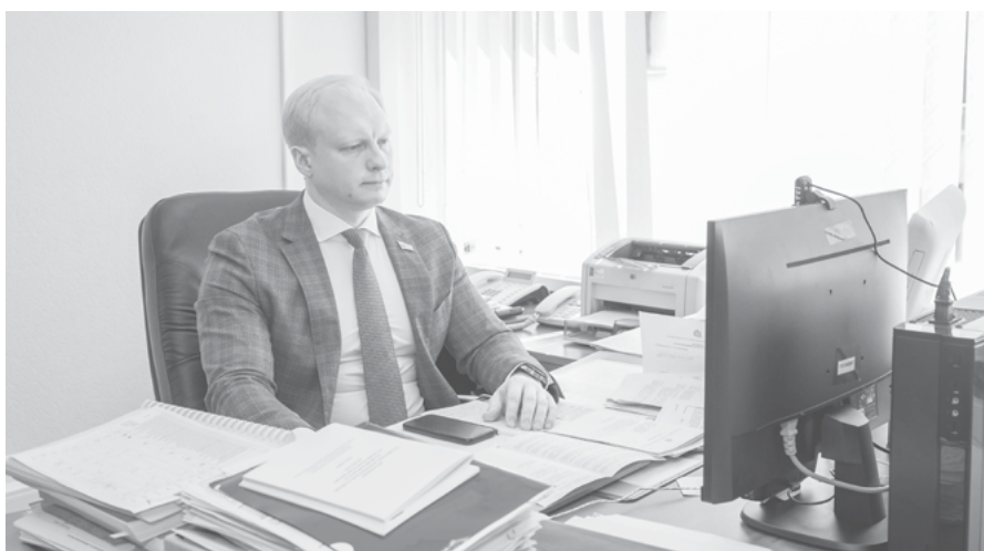
Подготовлено пресс-службой Законодательного Собрания Владимирской области

Омбудсмену теперь дано больше инструментов для решения задач в области защиты и восстановления прав граждан. Но появились и новые ограничения. Например, запрет на занятие Уполномоченным предпринимательской деятельностью, как лично, так и через доверенных лиц (исключения установлены федеральным законодательством). Омбудсмен обязан на протяжении всего срока своих полномочий проживать на территории области. В новой редакции прописано, что кандидат в Уполномоченные не может иметь гражданство иностранного государства либо вид на жительство за рубежом. А обязательные принципы его/ее деятельности – справедливость, гуманность, законность, гласность, беспристрастность.