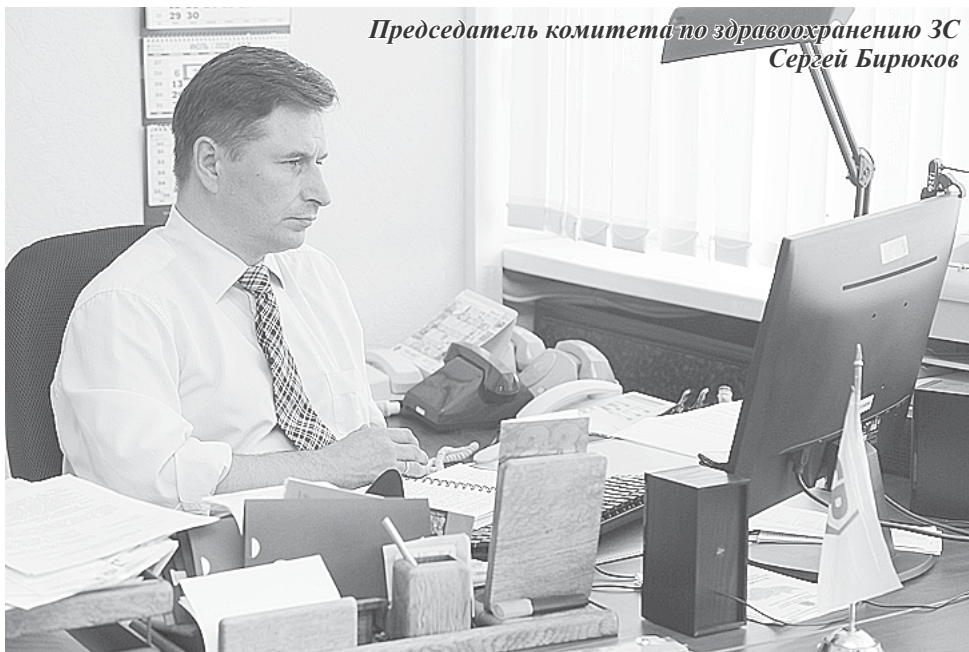
Председатель комитета по здравоохранению ЗС Сергей Бирюков

Задали вопрос и по струнинской больнице. Председатель комитета по здравоохранению ЗС Сергей Бирюков напомнил, что допущены множественные нарушения бюджетного и гражданского законодательства, законодательства о контрактной системе в сфере закупок и защите конкуренции. Счетная палата выявила оплату подрядчикам за фактически невыполненные работы, факты некачественного выполнения ремонта.