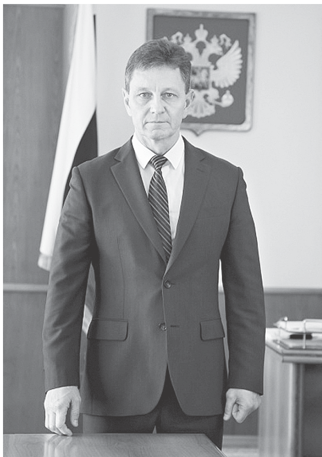
Уважаемые жители Владимирской области!

АДМИНИСТРАЦИЯ ВЛАДИМИРСКОЙ ОБЛАСТИ ИНФОРМИРУЕТ