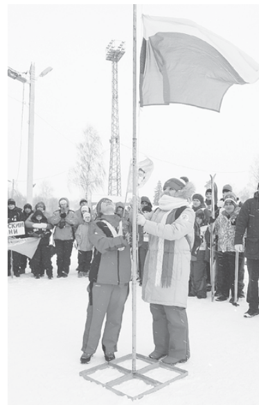
как в большом спорте!

Тусклое зимнее солнце, выглянув на пару минут, скрылось в серых тучах. К морозу добавился сильный ветер с метелью, словно пытаясь проверить на прочность участников соревнований. Пер-