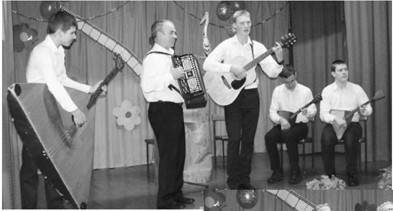
«Голос кольчугинца» уже рассказывал о том, что в Золотухинском сельском Доме культуры при полном аншлаге прошёл фестиваль, названный «Музыкальным серпантином» и приуроченный к объявленному Президентом РФ В.В. Путиным Году российского кино.

Гости — участники художественной самодеятельности сельских Домов культуры — съехались в Золотуху со всего Кольчугинского рай-