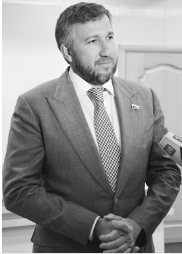
Депутат Государственной Думы РФ Григорий АНИКЕЕВ:

— Новогодние праздники прожиты особой атмосферой добра и душевного тепла. Мы подводим итоги, радуемся успехам и достижениям, верим в то, что самые заветные желания обязательно сбываются.