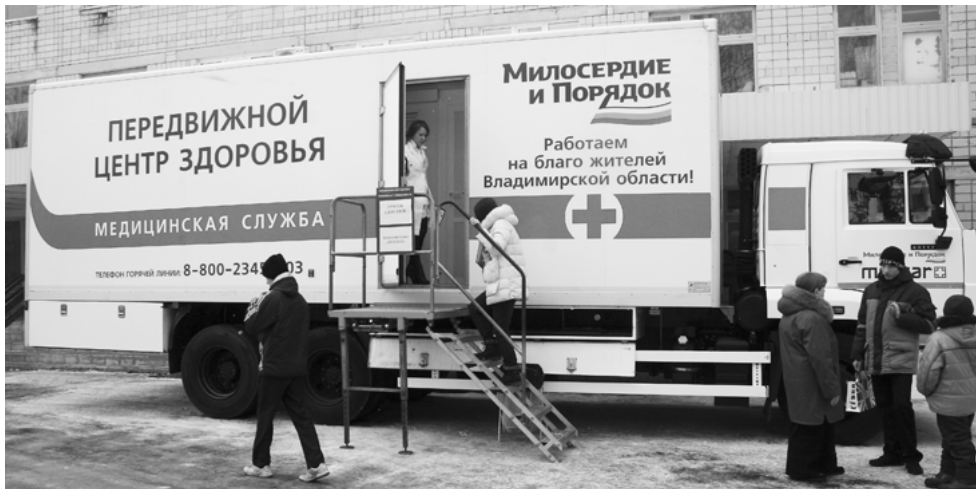
С ноября 2015 года более 2200 детей региона прошли бесплатные обследования

— Профилактический осмотр позволяет выявить возможные нарушения и