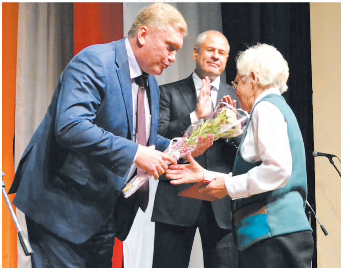
«Голос кольчугинца» уже рассказывал о том, что 16 сентября в Кольчугинском районе прошел заключительный этап областного форума-выставки «50 плюс». Все плюсы зрелого возраста». В его рамках прошло множество разнообразных мероприятий, и, конечно же, не обошлось без чествования уважаемых в нашем городе людей, удостоенных Почетных грамот и Благодарностей за активную гражданскую позицию и работу с ветеранами. Подробности – на 16 стр.