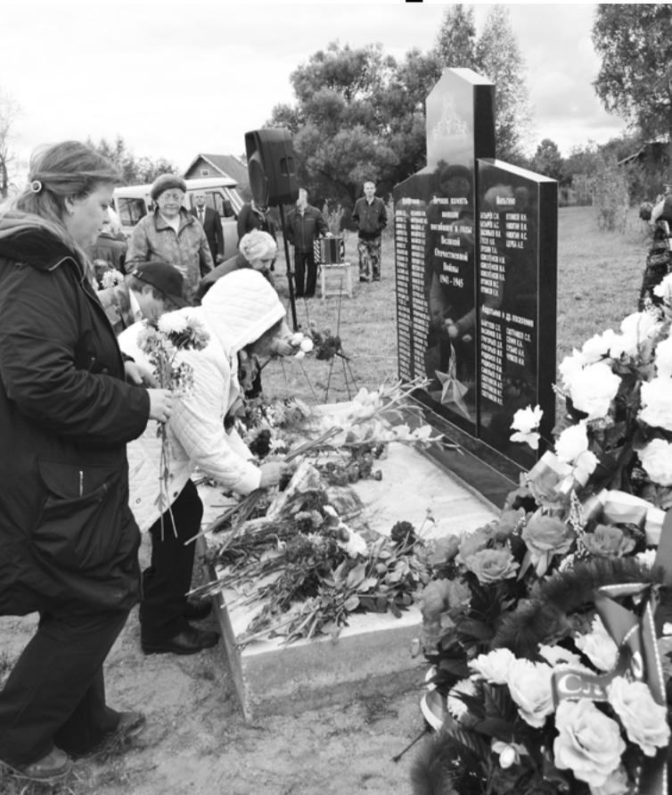
«Голос кольчугинца» уже рассказывал о том, что 10 сентября в центре села Новофетинино прошло торжественное мероприятие, посвящённое значимому событию: здесь открыли памятник землякам, призванным на фронт из Новофетининского сельского совета и погибшим в годы Великой Отечественной войны.

Инициатором его создания стал староста села – полковник