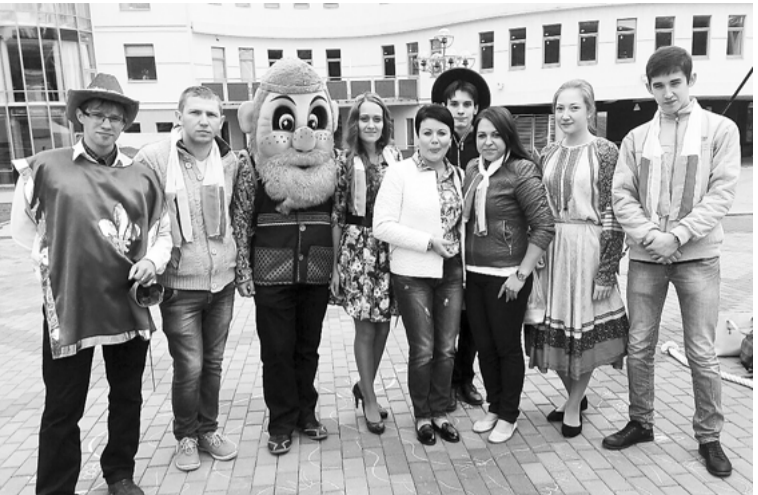
В Центральном парке областного центра прошел четвертый и пока самый масштабный фестиваль добровольческих проектов «ДоброСаммит», участниками которого, по официальной оценке, стали десять тысяч молодых людей. Организатором форума выступил комитет по молодежной политике администрации Владимирской области.

Новинкой форума стал Парад студенчества. В 13:00 от главного входа организованная колонна двинулась к главному фонтану. Во главе колонны шел духовой оркестр, вслед за ними шагали Губернатор Светлана Орлова, спикер областного парламента