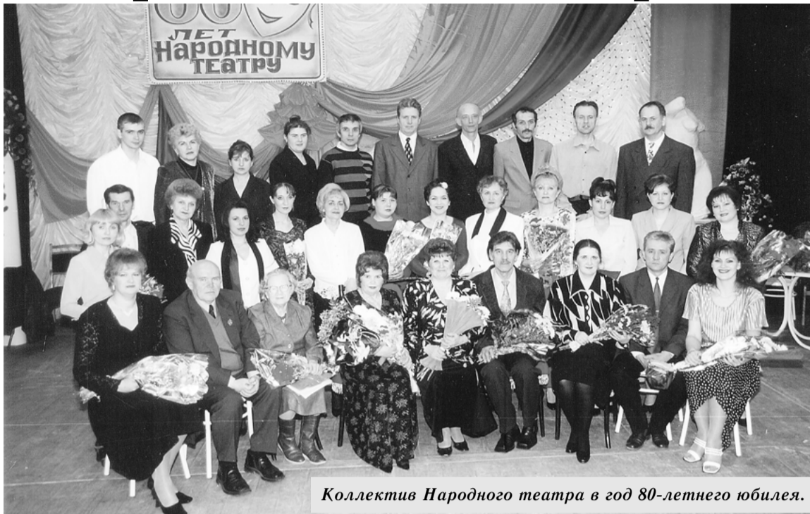
Коллектив Народного театра в год 80-летнего юбилея.

Творческая связь у меня с КТОСом Ленинского посёлка. Помогаю разнообразить культурный досуг жителей, организуем творческие вечера, встречи с интересными людьми. Знакомлюсь с ранее неизвестными мне талантами. Очаро-