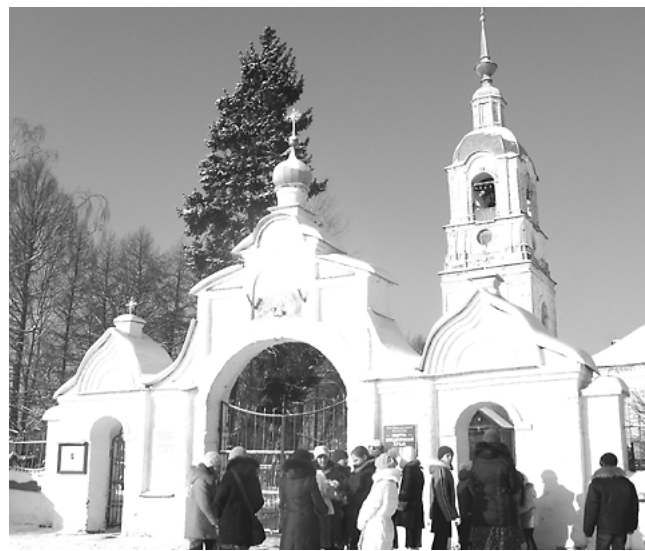
А на память о поездке у ребят остались вот такие красивые фотографии.

А потом взрослые и дети спустились к сельской часовенке, набрали воды из знаменитого флорищенского родника. Вода там, действительно, необыкновенно вкусная.