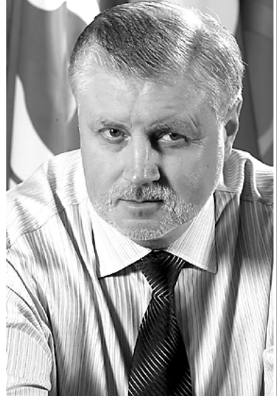
Сергей МИРОНОВ — Председатель Совета Федерации, лидер партии «Справедливая Россия: Родина/Пенсионеры/Жизнь»: «Справедливость — это когда экономический рост подчинен нуждам человека»