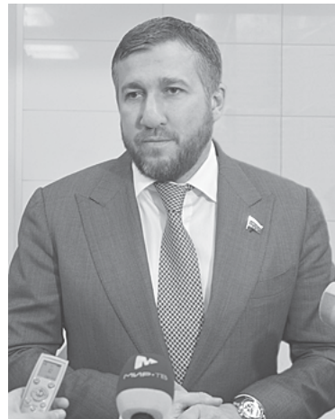
Депутат Государственной Думы РФ, председатель общественной организации «Милосердие и порядок» Григорий Викторович АНИКЕЕВ:

людям площадку для творческого развития и самореализации. Такие мероприятия объединяют активных и талантливых жителей Владимирской области, дарят радость общения и помогают землякам раскрыть свои способности, – отмечает депутат Государственной Думы РФ, председатель общественной организации «Милосердие и порядок» Григорий Викторович Аникеев.