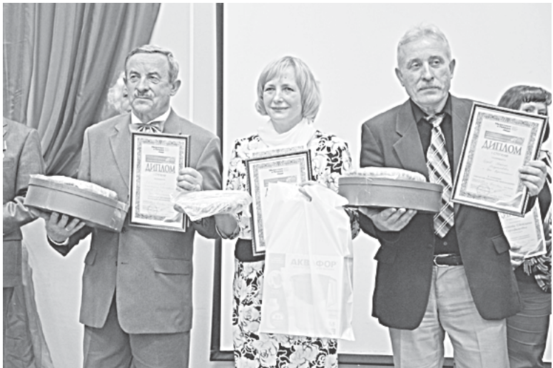
В оргкомитет конкурса поступило более 250 заявок.

В общественной организации «Милосердие и порядок» наградили победителей областного конкурса «Подари тепло своей души».