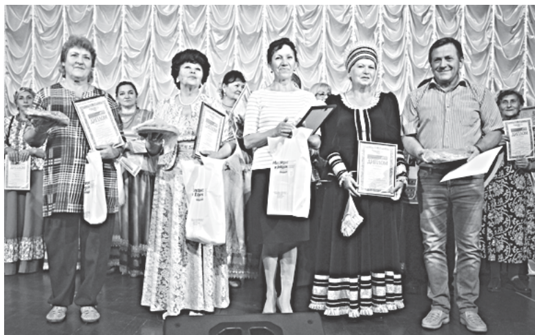
Победители в номинации «Эстрадный и народный вокал» (солисты)