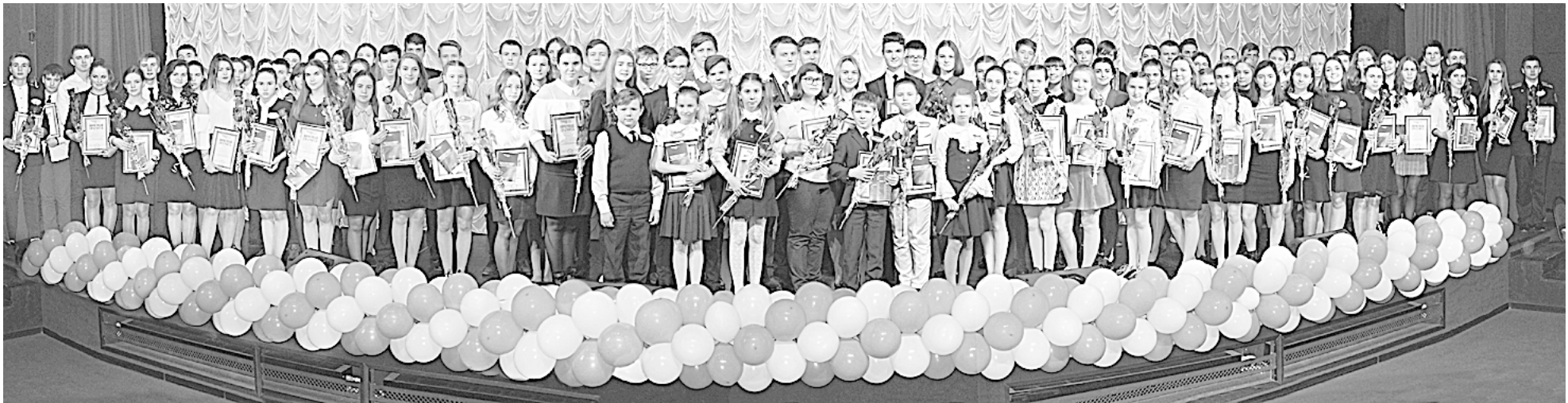
ПЕРСОНАЛЬНЫЕ СТИПЕНДИИ С 2001 ГОДА ПО ПРОГРАММЕ «СТАНЬ УСПЕШНЫМ – УЧИСЬ НОВОМУ!» ПОЛУЧИЛИ НЕСКОЛЬКО ТЫСЯЧ РЕБЯТ