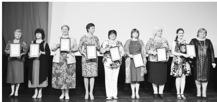
кальный проект художественной галереи.

Среди победителей грантового конкурса — участники из Кольчугинского района. Раздольевский сельский дом культуры отпразднует День физкультурника, Организационно-методический центр проведет районный конкурс «Хоровод народных праздников и обрядов», а в школе №4 города Кольчугино воплотят в жизнь универ-