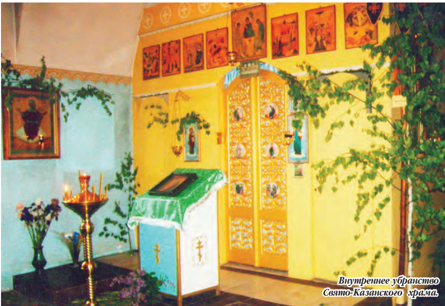
Внутреннее убранство Свято-Казанского храма.

в престольные праздники проводились крестные ходы. Живописна пойма реки Пекши, от её верховья до низовья, а в сёлах расположенным по её берегам были десятки православных храмов, часть из которых сегодня восстановлены. До глубины души на фоне