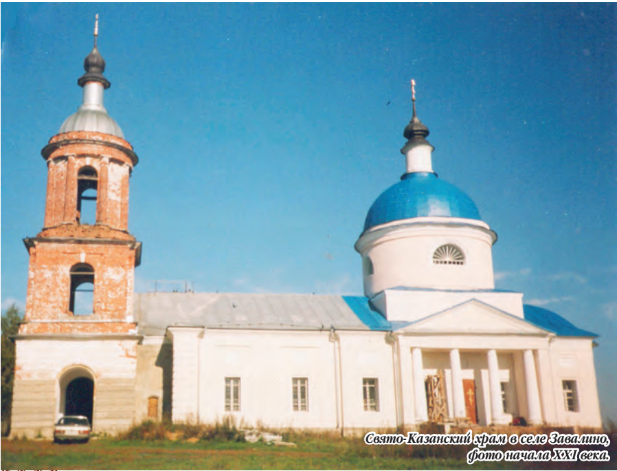
Свято-Казанский храм в селе Завалино, фото начала XXI века.