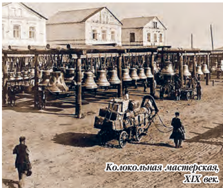
Колокольная мастерская, XIX век.

Мы знаем, что заводы купца Кольчугина принадлежали фирме «Вогау и Ко», но вот отливали ли здесь колокола достоверно неизвестно. Исторических документов не сохранилось. Однако я еще от своего деда, который работал в конце XIX века на заводе, слышал, что на медеплавильной печи, работавшей на участке литья самоварных деталей, выполнялись заказы церквей на отливку колоколов весом в несколько пудов. Вполне возможно, что небольшие по весу колокола были отлиты у нас и для Успенского кафедрального собора в Омске. Есть и такое предположение, что в начале 20-го века, при управляющем заводами товарищества Кольчугино В.И. Штуцере проводилось расширение, строительство дополнительного придела Покровского храма и колокольни и завод изготовил для этого и установил на колокольню новые колокола.