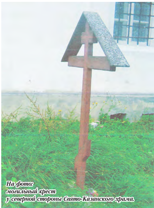
На фото: могильный крест у северной стороны Свято-Казанского храма.

В роду Акинфых - Крузенштернов было трое названы именем Елизавета. Вотчинники села были довольно богатыми и храму уделяли особое внимание. Он был хорошо и богато обеспечен дорогими святыми иконами: Божией Матери, Спаса, Николая Чудотворца и другими иконами в серебряных и позолоченных ризах. Куда всё это девалось? А может, находятся где-то в неизвестном потайном схроне. Этот поиск и был организован чтобы ответить на этот вопрос.