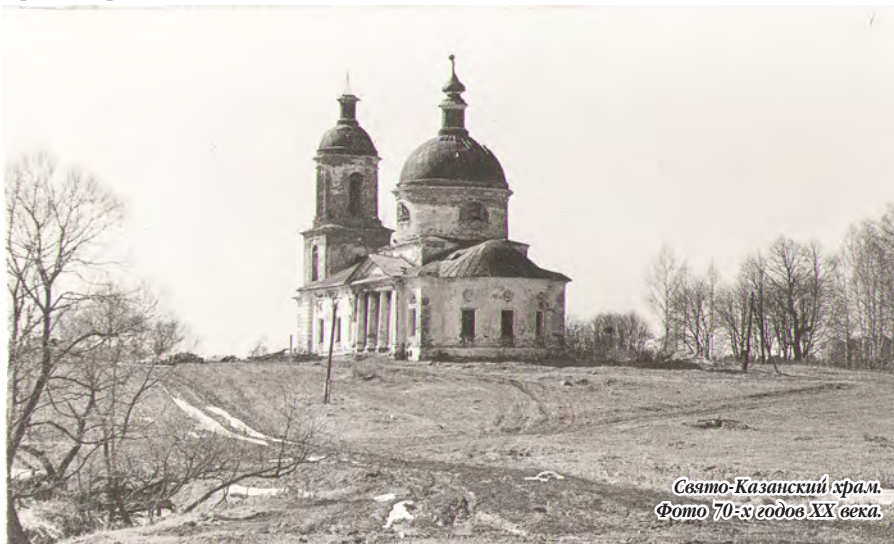
Свято-Казанский храм. Фото 70-х годов XX века.

Подобная судьба могла ожидать и церковь в селе Завалино. Но повезло. Храм сохранился.