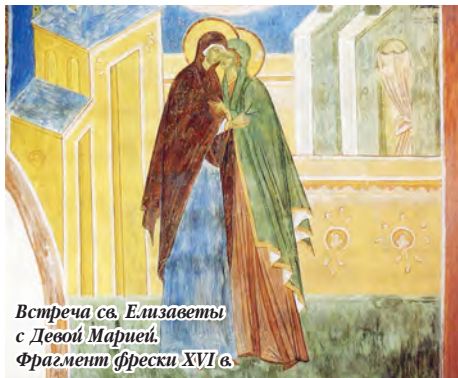
Встреча св. Елизаветы с Девой Марией. Фрагмент фрески XVI в.