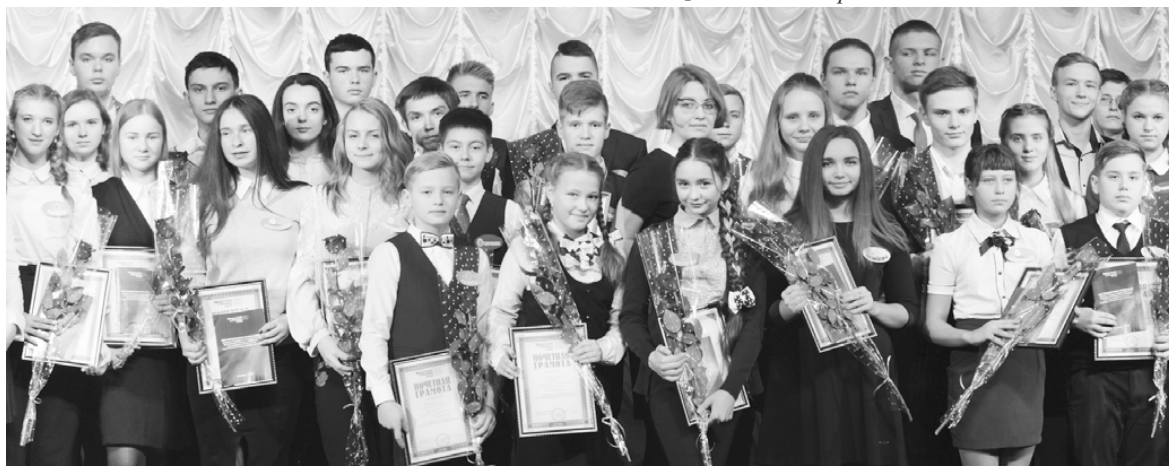
Более 3000 ребят получили персональные стипендии с 2001 года по программе «Стать успешным – учись новому!»

Депутат Госдумы Григорий АНИКЕЕВ: «Активные и талантливые молодые люди – это интеллектуальный потенциал нашей страны. Наша общая задача – оказать им поддержку»