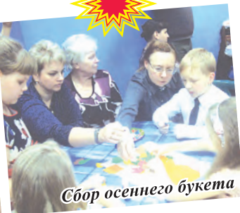
Сбор осеннего букета