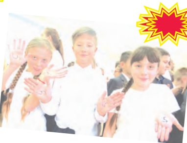
Лица ЛУШИНА, 5 «Б» класс, школа №1

В самом конце торжества старшеклассники спустились в зал и всем ребятам нарисовали на ладошках маркером цифру 5. Это значит, что они стали самими настоящими пятиклассниками! Чуть позже надпись на ладонях покрыли мелом, чтоб надпись дольше держалась!!! Я думаю, мои одноклассники потом долго не мыли руки, чтобы заветные пятерки напоминали им о том, что теперь они уже совсем взрослые!