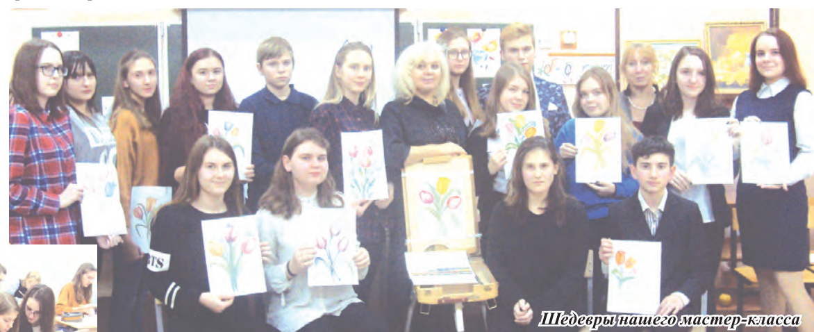
Шедевры нашего мастер-класса

Ребят уже начали поторапливать педагоги, но разошедшиеся юные