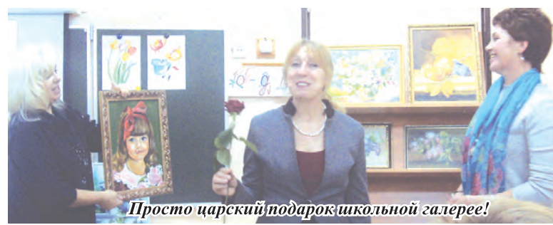
Просто царский подарок школьной галерее!