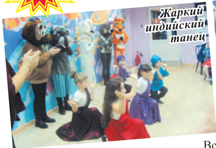
Жаркий индийский танец