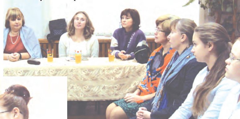
Наше строгое жюри

дут направлены для участия в областном этапе конкурса исследовательских краеведческих работ школьников – участников туристско-краеведческого движения «Отечество».